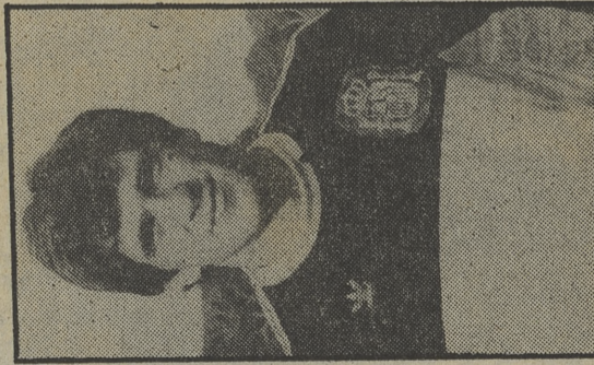
No tendrá demasiado trabajo Arconada contra Luxemburgo

23.45 TELEDIARIO 3 0.15 TELEDEPORTE 0.30 DESPEDIDA Y CIERRE