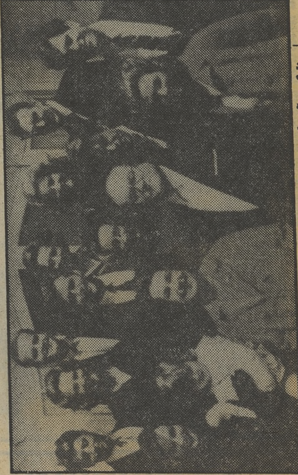
Todos los Kennedy, en una foto de cumpleaños feliz.