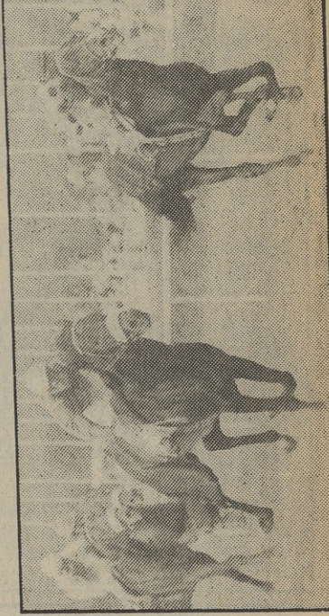
Un programa televisivo con mucho galope