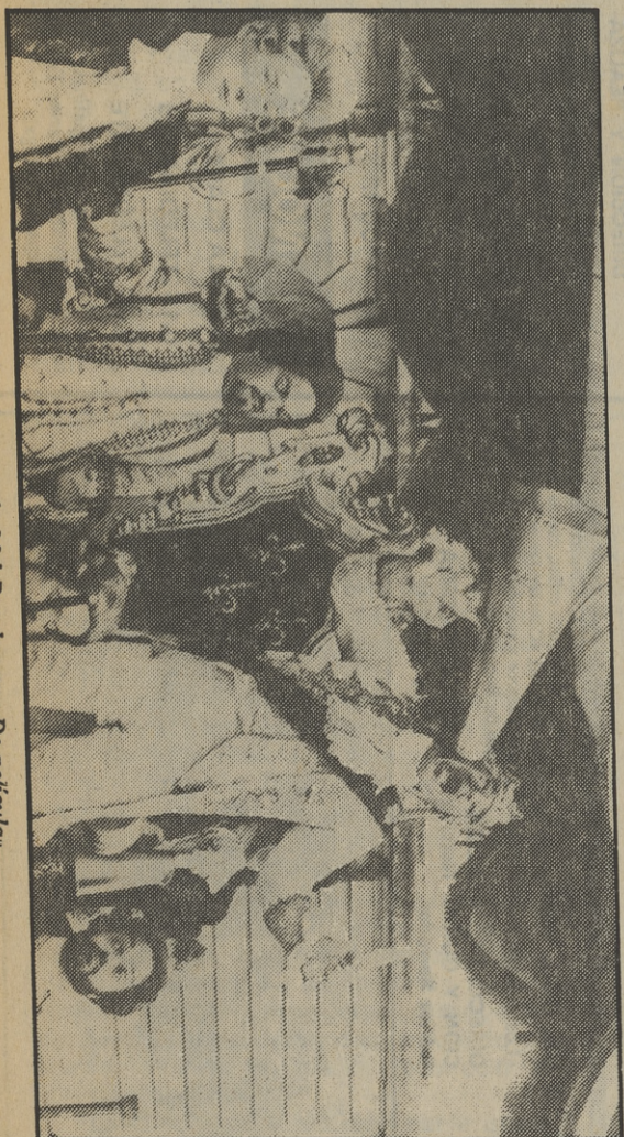
Las locuras de Mel Brooks, en «De peliçula»