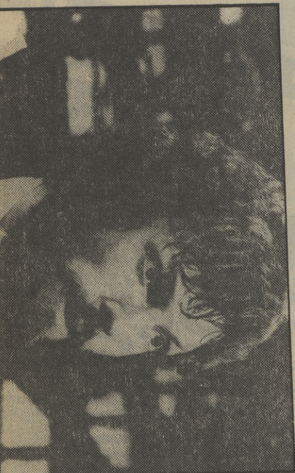
Richard Chamberlain es el conde de Montecristo, en «Primera sesión»