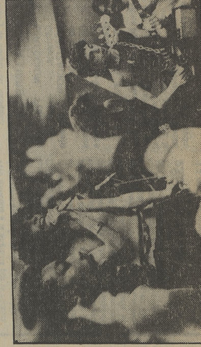
Los chicos de «Fama», en acción