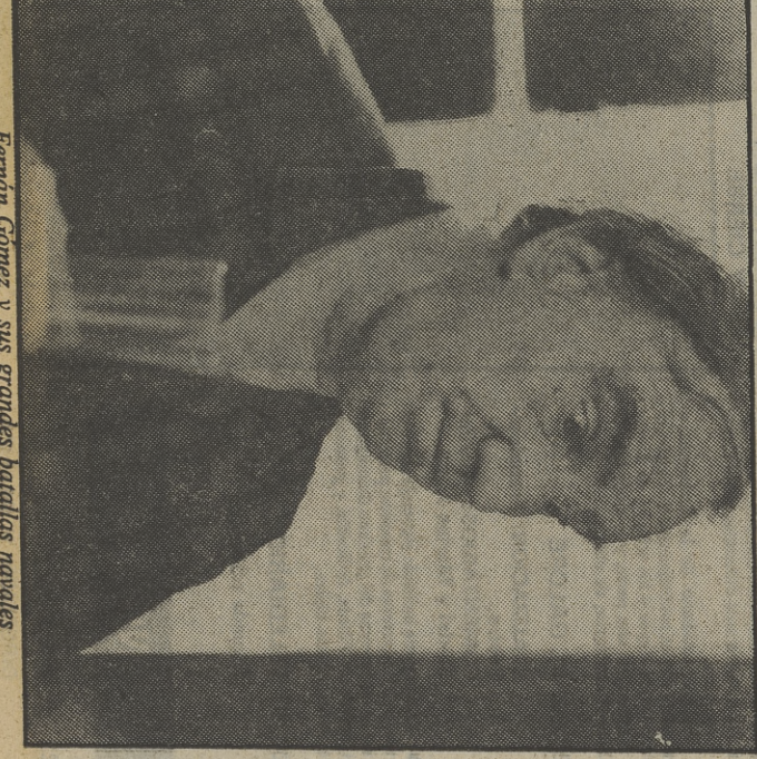
Fernán Gómez y sus grandes batallas navales