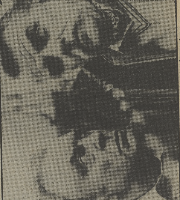
La discordia hace que la serie sea más graciosa

21.05 EN BUSCA DEL TESORO DIRECCION: León Urzaiz. REALIZACION: Rafael Galán. PRESENTADORES: Isabel Vázquez.