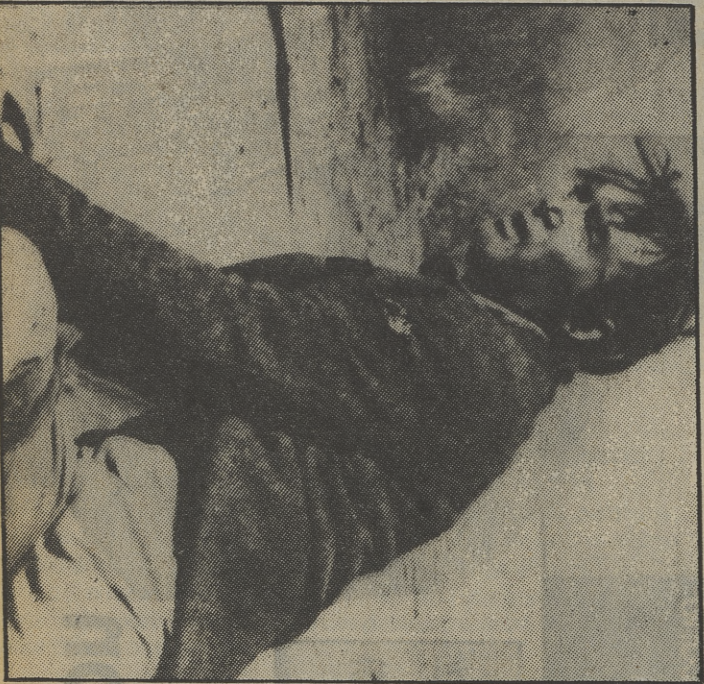
James Stewart es el héroe solitario

DIRECCION: Billy Wilder. AUTOR: Charles A. Lindbergh. GUION: Wilder-Mayes-Lederer. MUSICA: Franz Waxman. INTERPRETES: James