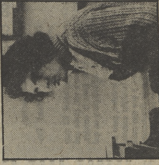
Los de «Fama» siguen volando