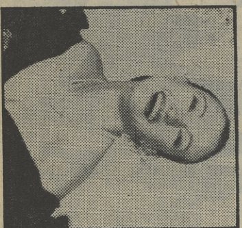
No es la Pimpinela, pero Jane Seymour trabaja en la serie