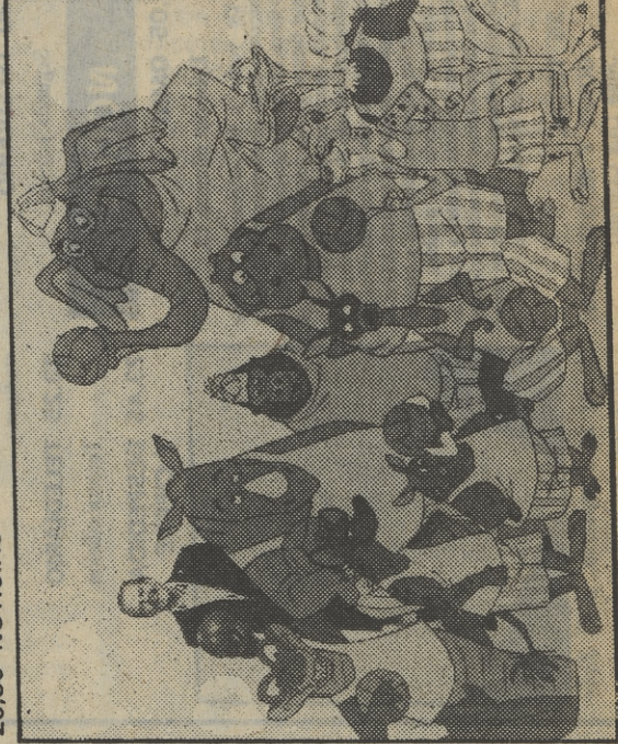
El increíble mundo de Walt Disney en la tarde dominical