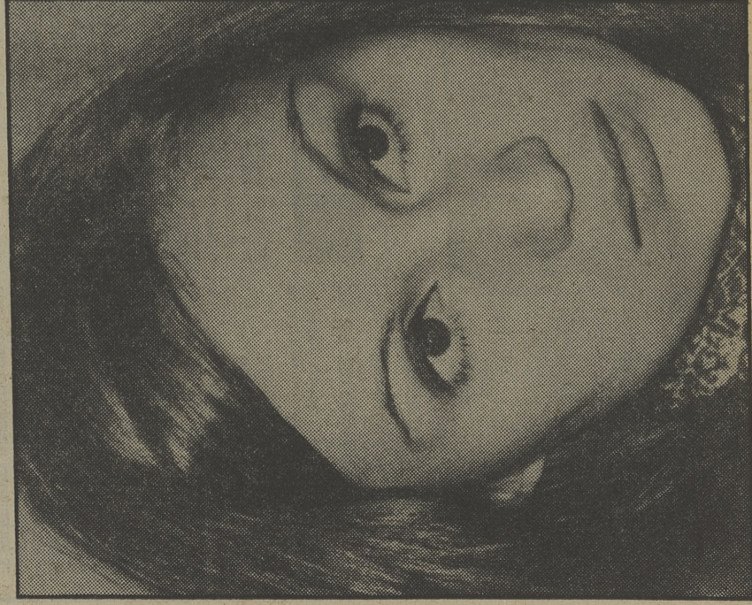
Ana Diosdado, en la serie «Anillos de oro»