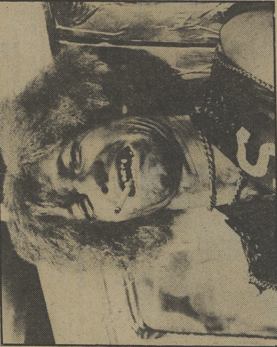
¿Se han fijado en su manera de fumar? («Paul Hogan»)