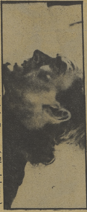
Errol Flynn, en «La dinastía de los Forsyten» («El melodrama»)