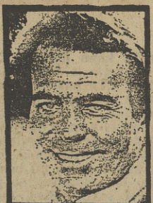
Raphael (1962) y Julio Iglesias (1968), los mayores «descubrimientos» del festival.