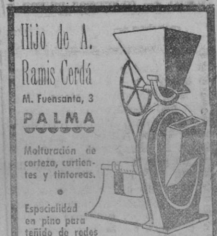
Moltradura de corteza, curtiembres y tintorerías.

Especialidad en pino para tejido de redes