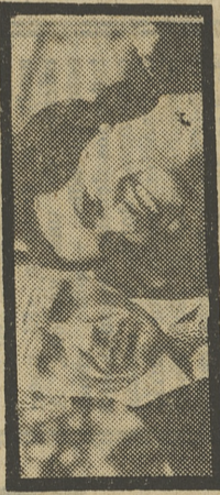
EDWARD FOX Y CYNTHIA HARRIS