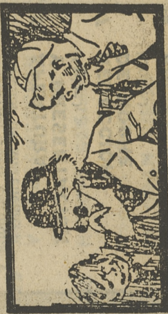
«LAS AVENTURAS DE GUILLERMO»

Guillermo está disgustado porque no puede jugar al badminton con sus amigos, al no tener una raqueta. También tiene sus problemas con el nuevo profesor de francés, que está dispuesto a enseñarle el idioma cueste lo que cueste. Con el fin de eludir la clase y el severo castigo que le espera si no se sabe la lección, Guillermo finge que está enfermo y con dolores de estómago.