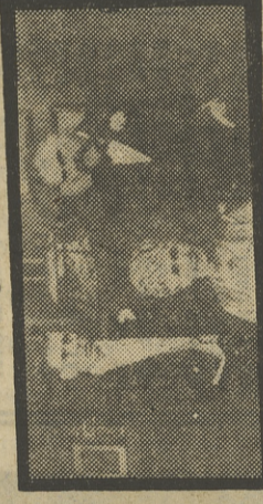
LA FAMILIA REAL INGLESA

10,35 GRANDES RELATOS (Color.) -EDUARDO Y LA SEÑORA SIMPSON. «El príncipe heredero». (Capítulo I). Dirección: Waris Hussein. Interpretes: Edward Fox, Cynthia Harris, Andrew Ray, Dame Peggy Aschroft Marius Goring y David Waller.