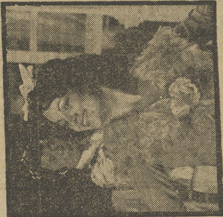
ANTOLOGIA DE LA ZARZUELA