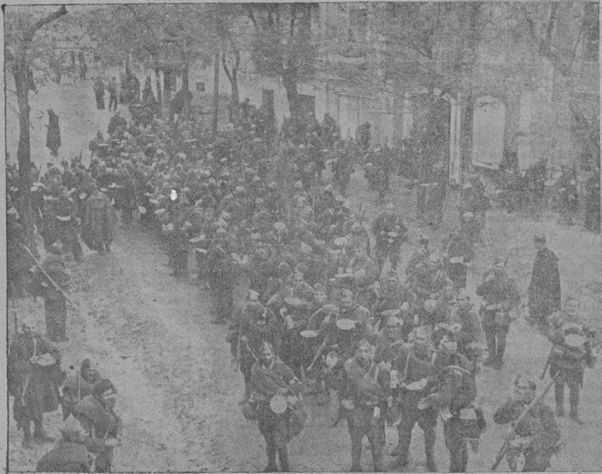
FRENTE DE SIGÜENZA. —Una de las columnas del ejército nacional que operan en el frente de Guadalajara en el momento de tomar el rancho en uno de los pueblos conquistados.