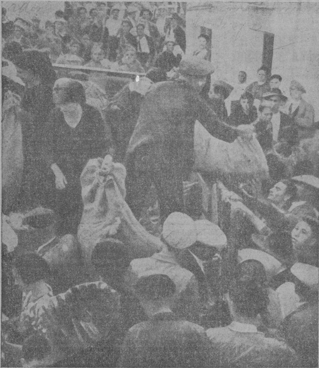
A medida que el Ejército Azul va reconquistando pueblos para España, caravanas de víveres que les siguen entregan alimentos y ropas a las gentes despojadas de todo por el furor marxista.