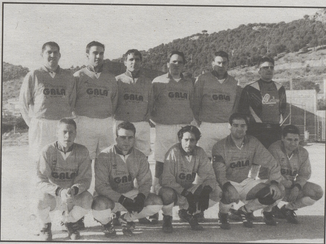
Equipo del Navatalgordo.

dad al equipo visitante. Con el paso de los minutos, el Navatalgordo consiguió sacudir el dominio y la batalla táctica se trasladó al centro del campo, desde donde los dos equipos salían con verdadero peligro hacia el marco contrario.