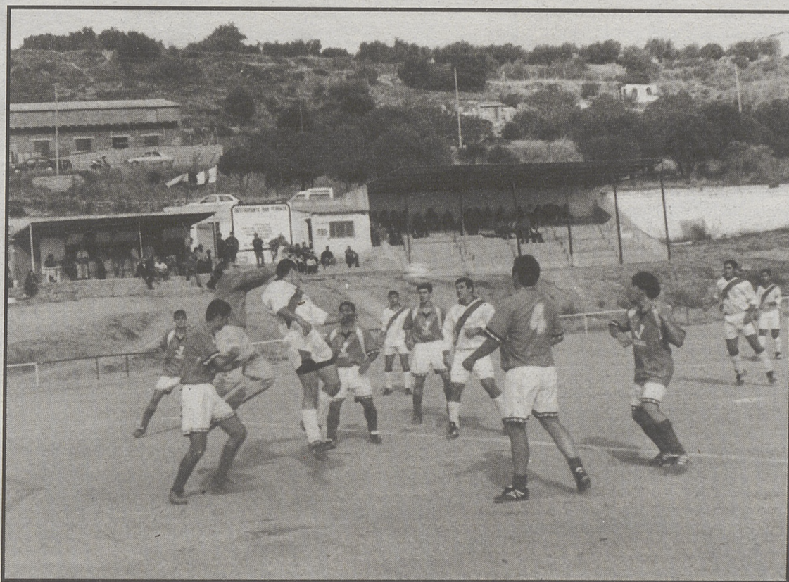
Imagen de un encuentro del Hoyo de Pinares en la presente temporada.

• INCIDENCIAS: Partido correspondiente a la 15ª jornada de la Provincial de Aficionados disputado en el campo de San Miguel Arcángel, muy bien rastrillado. Unos 200 espectadores. Todos los jugadores del equipo local llevaban en el pecho de su camiseta la leyenda "¡y la luz!". En esta ocasión sí que se pudieron duchar con agua caliente, aunque los vestuarios continúan siendo una zahúrda.