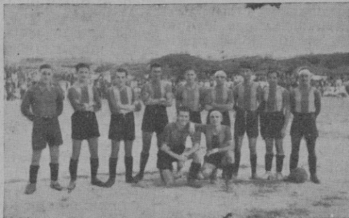
El equipo del C. D. Menorca, que mañana se enfrentará al del Ciudadela