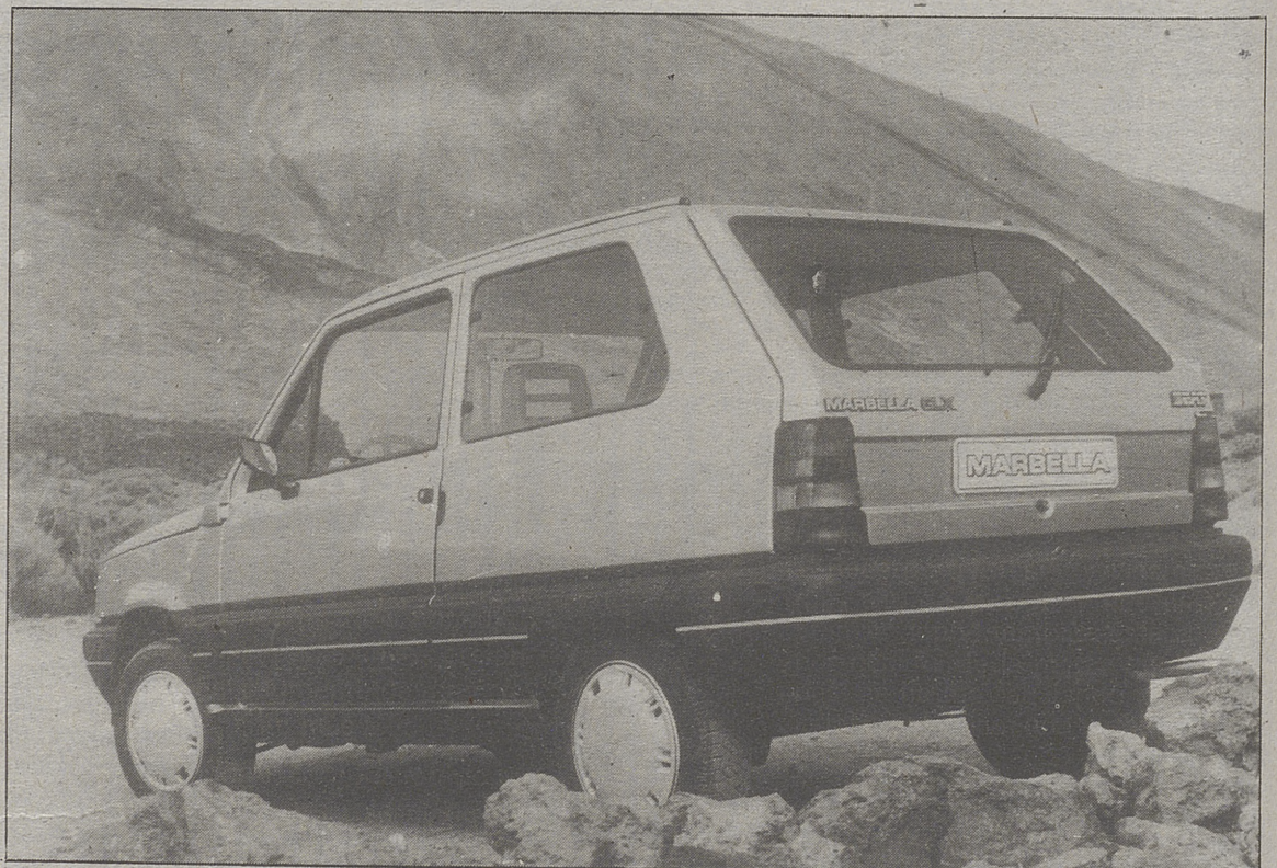
Se creará una empresa mixta para aumentar la venta y asistencia técnica.

«La única ventaja -continuo- sobre los mercados eurooccidentales es que el coste laboral va ser menor y esto puede interesar para la fabricación de algunos productos específicos. Jouchoux dijo que todavía es pronto para efectuar una valoración del desarrollo de mercado automovilístico al final de este año aunque se mostró optimista, en que «al menos se quede equilibrado, con respecto al año anterior».