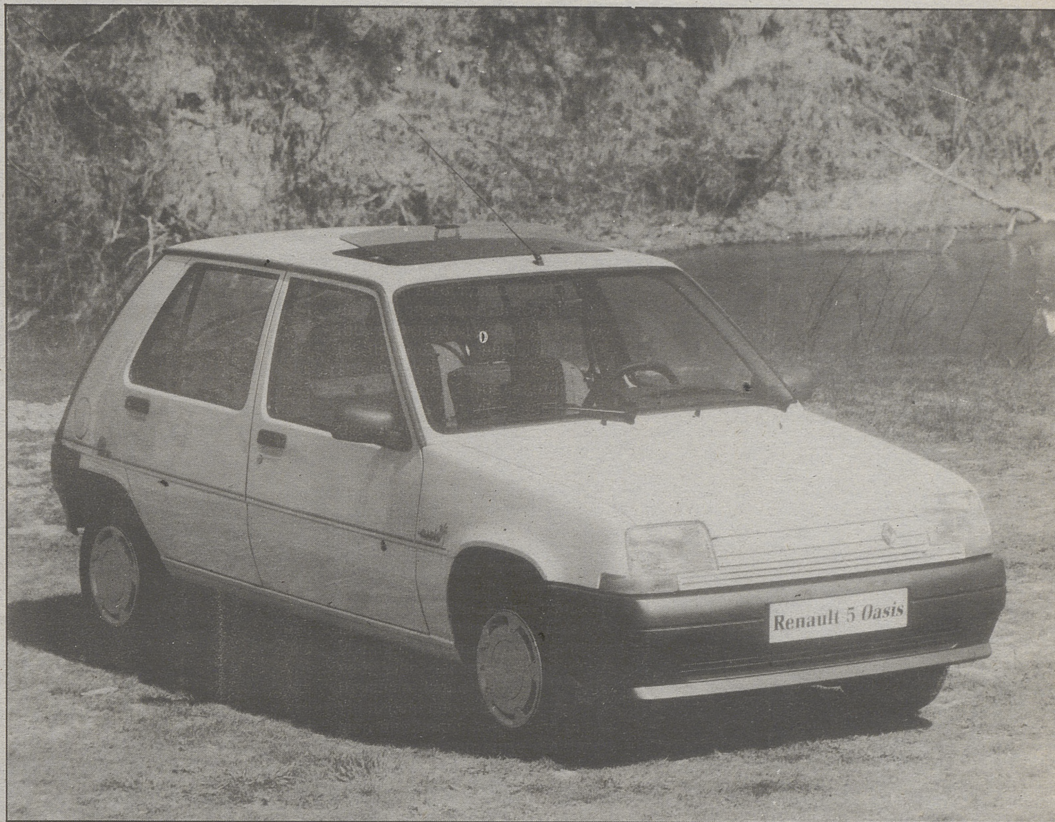
El Oasis tiene un precio asequible pero sin restar importancia y detalles a su equipamiento.

Las piezas de polipropileno se almacenan y, con la ayuda de las compañías de reciclaje, se vuelven a utilizar. Empresas especializadas recogen las baterías viejas para recuperar la carcasa y utilizarla en baterías nuevas. Los ingenieros de Opel, trabajando conjuntamente con la industria del reciclaje, han encontrado la forma de reutilizar el plástico de las carcasas.