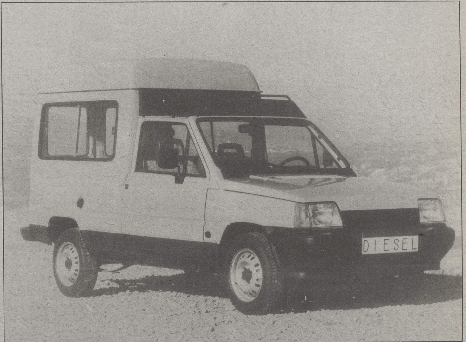
La nueva Terra ha mejorado su interior para aumentar su confort.