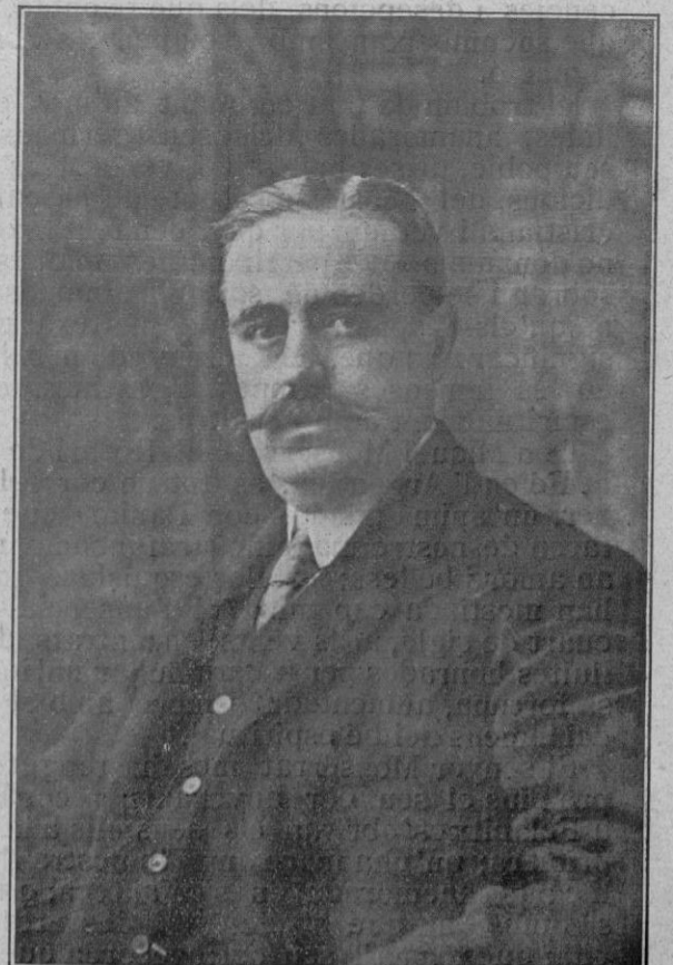
D. Salvador Vidal Valls de Padrinas (Ex-Alcalde y ex-Diputado Provincial.)