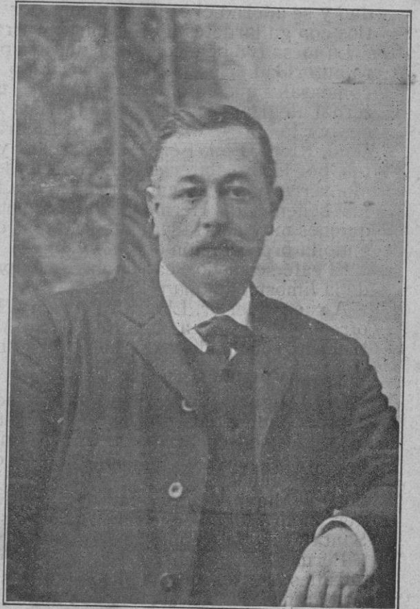
D. Juan Caldentey (Alcalde.)

Para el cumplimiento de este encargo se nombró una Comisión compuesta de nuestro Rdo. Cura Arci-