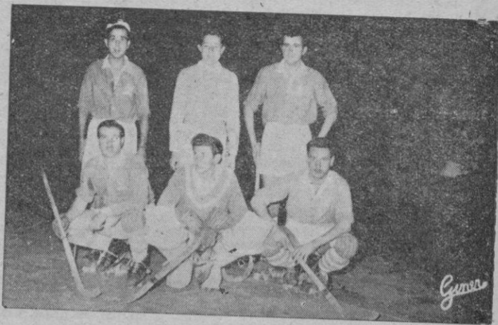
El equipo del Hispania, momentos antes de iniciarse el partido contra el Burgos

Una suspensión que ha producido muchos perjuicios