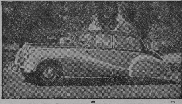
La 37 Exposición Internacional del Automóvil de Londres, ha sido la más importante de las organizadas hasta ahora. En la foto, uno de los modelos que llamaron poderosamente la atención de los visitantes