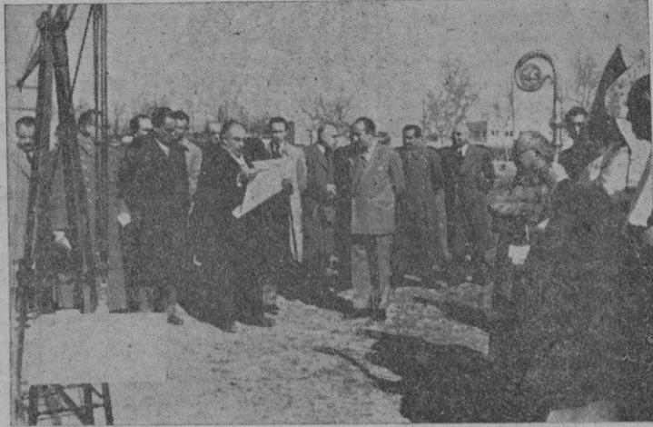
Las autoridades que asistieron al acto de la bendición de la primera piedra.

En la planta baja de dicho Instituto se sitúan los dispensarios de Obstetricia y Ginecología, la Clínica de esta última especiali-