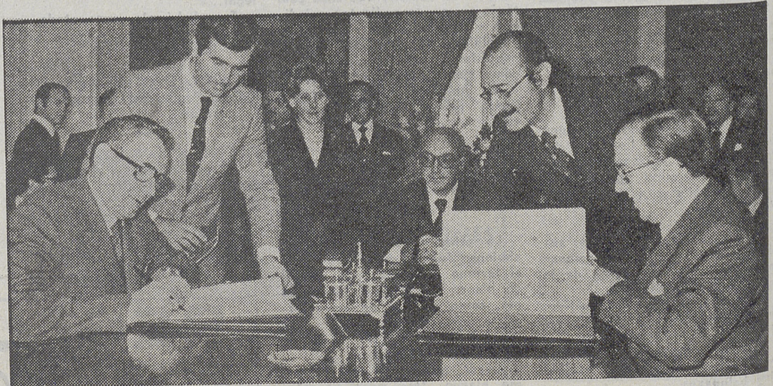
El ministro de Asuntos Exteriores de la URSS, Andrei Gromyko, firmó con su colega español, Marcelino Oreja, un acuerdo de mutua cooperación cultural entre España y la URSS. En el acto se hallaba presente, el ministro de Cultura, Clavero Arévalo.