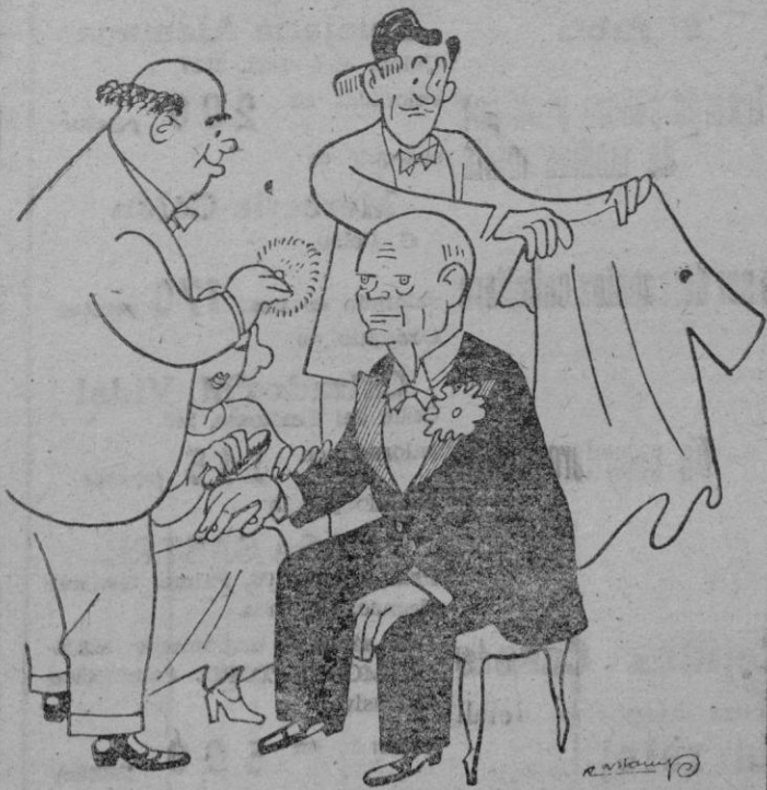
—Sr. Eisenhower, a escena!