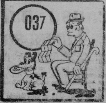
DORREO DE MALLORCA PAGINA DOS

Otras funciones —En San Felipe Neri. Adoración: Nocturna. Turno de Guardia. San Sebastian. —En el Socorro, a las 7 de la