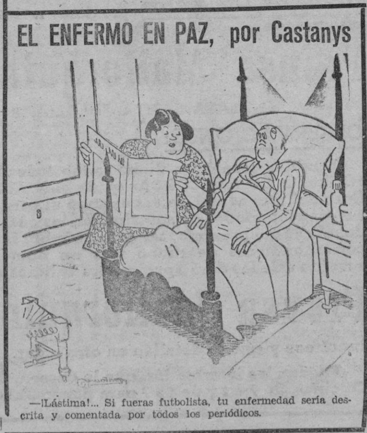
—¡Lástima!... Si fueras futbolista, tu enfermedad sería descrita y comentada por todos los periódicos.

Se cree que el artículo «L'Humanité» es una noticia para que continúe en Moscú.