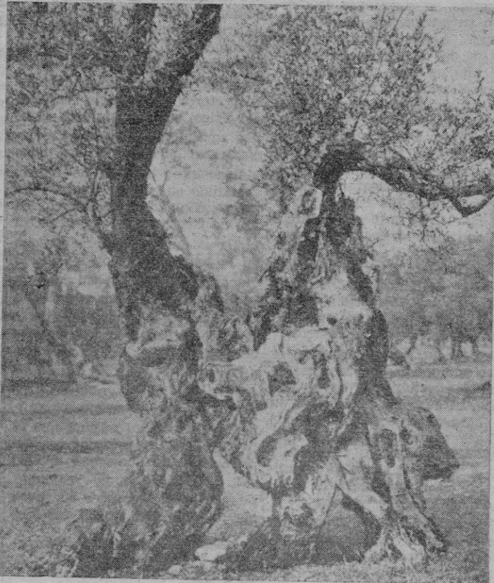
Un magnífico ejemplar de un centenario olivo mallorquín