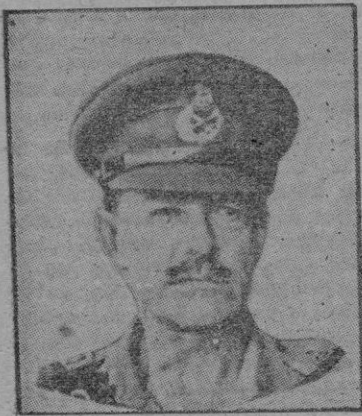
El general Eisenhower

Con la designación de sus candidatos a la Presidencia de los Estados Unidos, por los dos principales partidos norteamericanos —el demócrata y el republicano—, los ciudadanos de la Unión han salido de una incertidumbre, aunque no sea más que para entrar en otra. En realidad, hay tan poca diferencia en los ideales de ambos partidos que bien puede decirse que se esfuma ante la posición conservadora candidato demócrata, pese al