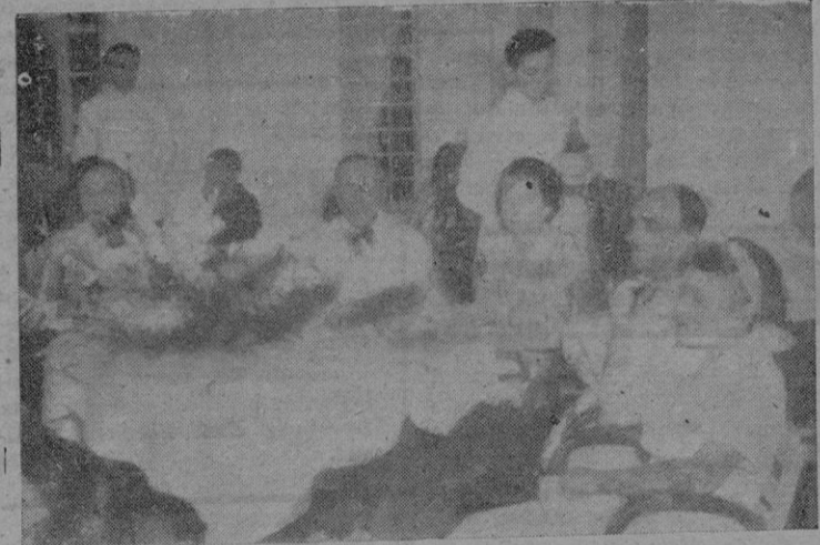
La Princesa Juana de Saboya rodeada de sus distinguidos acompañantes durante la brillante fiesta.