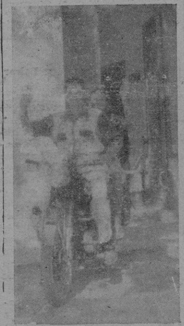
Los esposos De Toledo, que han realizado el «Tour a Mallorca»

—Me gustan los toros, como a cualquier extranjero. Me gusta el trabajo del «doreador», pero detesto la suerte de la