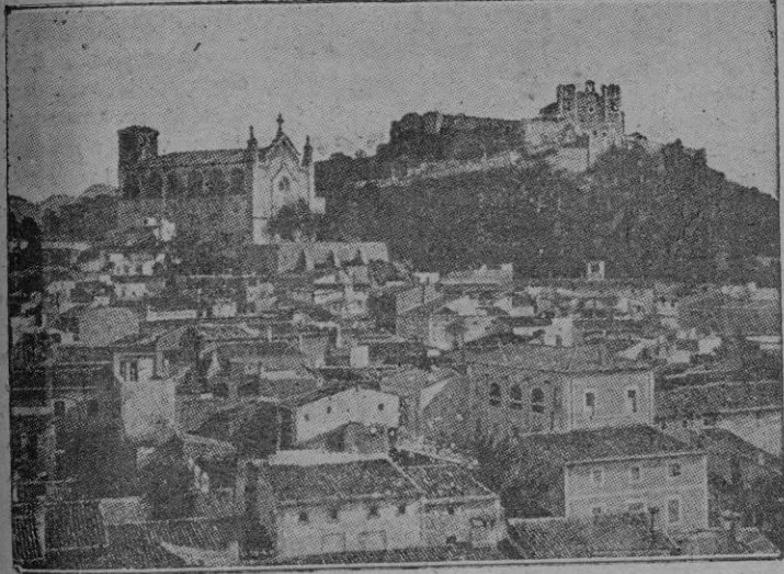
Vista parcial de Artá, y en la cima del montículo, el Santuario de Nuestra Señora de San Salvador

vaño recinto amenado; el mar nos une con la Isla hermana, cuya silueta se vislumbra en los días claros; gigantescos montes pelados, en cuya cima se divisa la antigua atalaya de señales; los múltiples ventanales de las señorial casa de campo «des Olor» y el frondoso fondo verdinegro de la casa «des Pujob» y más lejos la acogedora y sonriente villa de Artá, el grandioso convento de los PP. Franciscanos, el magnífico