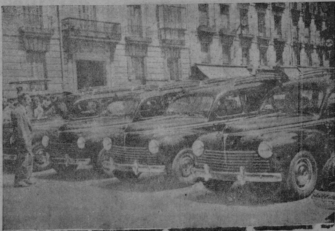
Muy pronto van a entrar en servicio cien nuevos taxis iguales a los que aparecen en la foto, y que son de fabricación francesa, pero no en las calles de Palma sino en las de Madrid, a los cuales se unirán en breve plazo otros doscientos de distintas marcas.