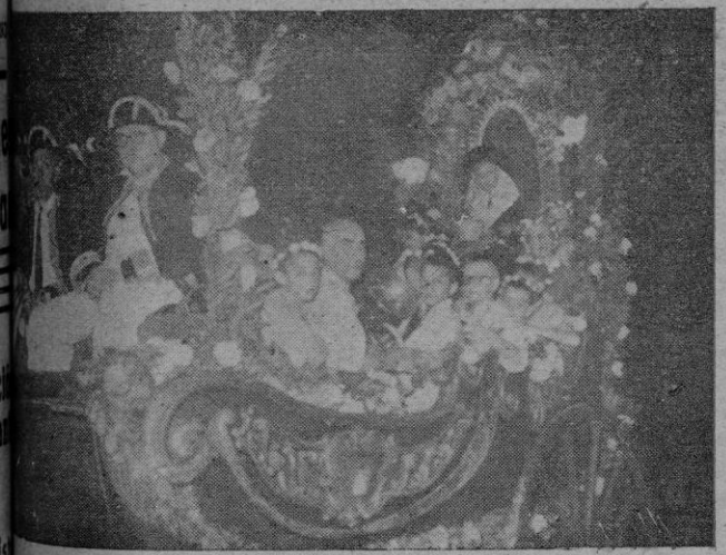
La tradicional cabalgata en honor de Santa Catalina. Thor recorrió anteayer, primer domingo de agosto, las calles de...

Washington 4 (Efe). — «Los Estados Unidos practican una política de supremacía blanca, que perjudica a su dirección del mundo» — dice una subcomisión de la Asociación Católica pro paz mundial.