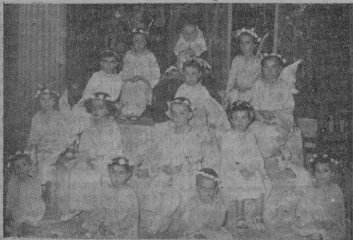
La «Beata» con su Corte de honor

—o— Cuando ya empezaba a anochecer poco más de las ocho, salió de la explanada entre el Instituto Ramon Llull y Escuela de Artes y Oficios la cabalgata del Carro triunfal de la «Beata», que debía recorrer, hasta altas horas de la noche, las principales calles de la ciudad, cantando durante el trayecto las populares