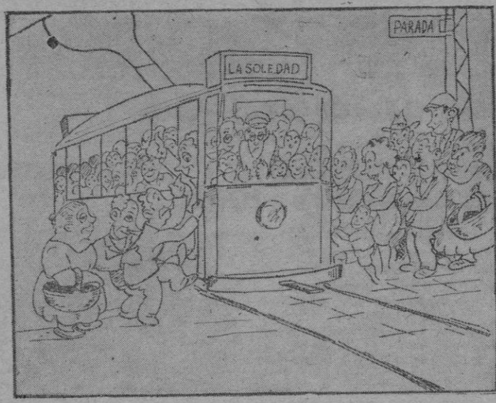
PARADOJA DE UN TRANVIA, por Biel

En la Jefatura de la Guardia Municipal de esta Capital se halla depositado un coche-cito de paseo para criatura encontrado en la Vía Pública y será recuperado por quien acredite ser de su legítima propiedad.