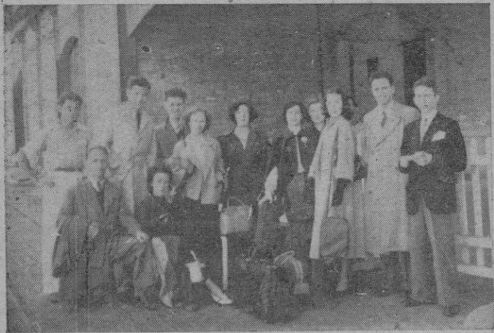
El grupo de Irlanda, recién llegado ayer por la mañana, posa para CORREO DE MALLORCA