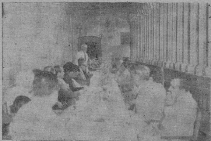
Un aspecto del acto celebrado, en la mañana de ayer, en el claustro de San Francisco. (Amplia información en páginas anteriores)