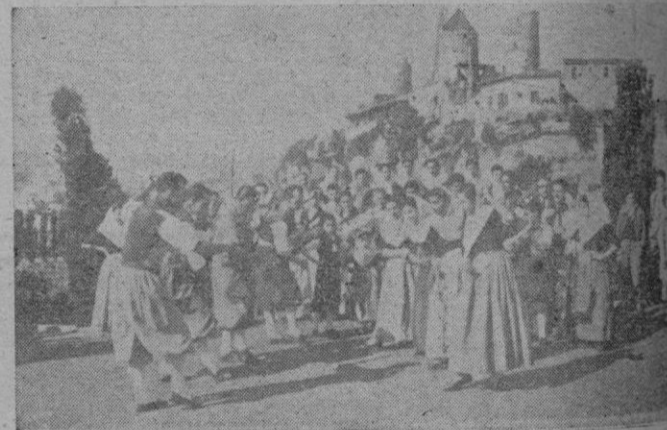
La notable agrupación "Balls de Mallorca"

ALICANTE, 21 (Servicio especial) — Después de un viaje muy feliz, llegó la agrupación folklórica "Balls de Mallorca", la representación mallorquina. Se desfiló por las calles de la ciudad fué brillantísimo, vistoso y chigados "Balls de Mallorca" a actuar en algunas vias, entre el entusiasmo popular.