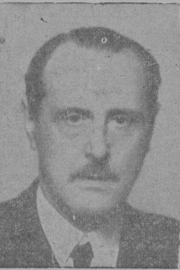
DON ESTEBAN BILBAO

Madrid, 14 -- Terminada la ceremonia de la jura de los nuevos procuradores, el Presidente de las Cortes, don Esteban Bilbao pronunció interesante discurso.