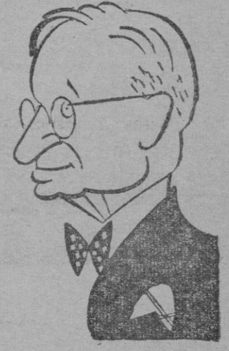
El presidente Truman

Truman señaló que los citados tres puntos formulados por el general Ridgway forman un todo. Deben considerarse como una entidad no como piezas sueltas, dijo Nuestro acuerdo agregó, se basa en la aceptación de toda la proposición; esa es nuestra postura. Los comunistas —añadió— han indicado por ahora