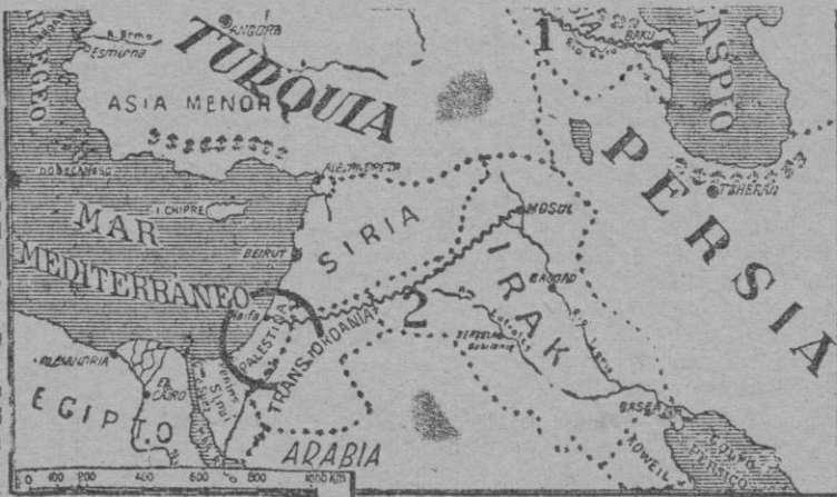
Mapa donde puede verse la situación geográfica del Iraq y se señala el oleoducto de Mosul a Haifa

El reino del Iraq corresponde a la antigua Mesopotamia, la cual sabido es que juega un importantísimo papel en las viejas civilizaciones sumeriana, babilónica y sasánida. Quien haya saludado simplemente la historia antigua, habrá tropezado cien veces con nombres de tanta resonancia como Babilonia y Ninive, emporios de