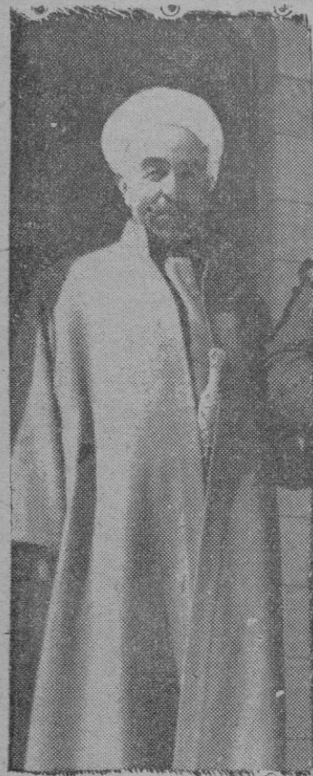
El Cherif Hussein, jefe de la familia hachemita, padre del primer monarca iraquí, Faisal I

riqueza y centros de gran florecimiento y poder militar, de los cuales se barajaban otros nombres de monarcas celeberrimos.