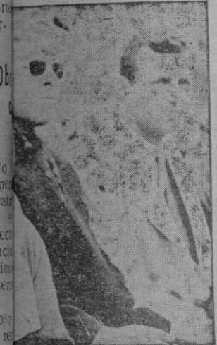
La presencia de un encuentro en "Es Forti"

—Ninguna. Kubala —repite— tiene contrato con el Barcelona hasta el final de la próxima. Cuando llegue dicha fecha habrá llegado el momento de que exponga sus deseos. Mientras tanto Kubala es jugador barcelonista y seguirá siéndolo hasta aquella fecha.