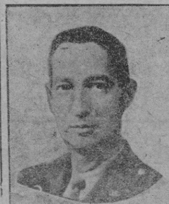
El general Clark

fué hecho por el Consejo de la NATO (Continúa en página diez)