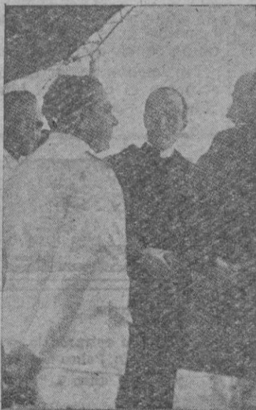
Del Congreso Eucarístico Internacional de Buenos Aires—El Cardenal Legado, Monseñor Pacelli, hoy Pio XII, en viaje a la Argentina a bordo del trasatlántico "Conte Grande", para asistir al Congreso