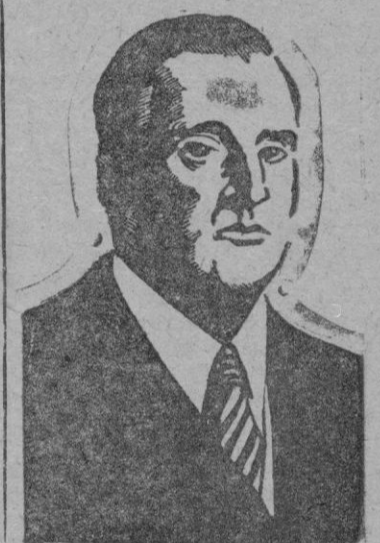
El Ministro de Asuntos Exteriores

Por último, manifestó su confianza por la misión española que sea seguida por otras visitas a España de algunos Jefes de Estado y de Gobierno.