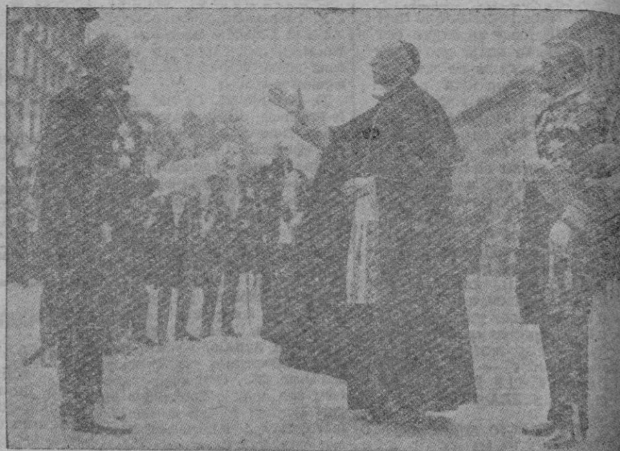
Foto retrospectiva relativa al Congreso Eucarístico Internacional de Budapest. El entonces Cardenal Monseñor Pacelli, Legado del Papa al Congreso llega a la capital húngara y corresponde al saludo del burgo maestro de la ciudad Szendy. Detrás de Monseñor Pacelli aparece el entonces Regente de Hungría Almirante Horthy.

El primer Congreso Eucarístico se celebró en Lille en 1881, y el último, en Budapest, presidido por Monseñor Pacelli