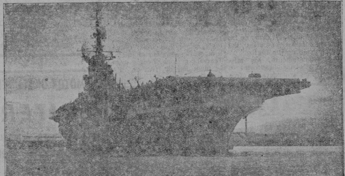
Magnífica foto del portaaviones norteamericano "Tarawa" anclado en la bahía de Palma