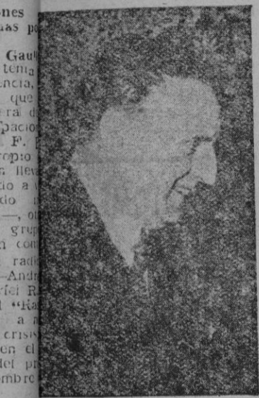
Ministro de Asuntos Exteriores

De todas formas sea designado Eisenhower o Truman piensa hacer campaña activa en favor del candidato demócrata sea quien sea.