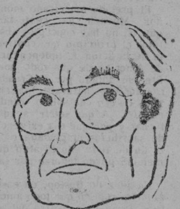
El Presidente Truman

A una pregunta, dijo que él podría presentarse frente a un hombre en quien tiene tan