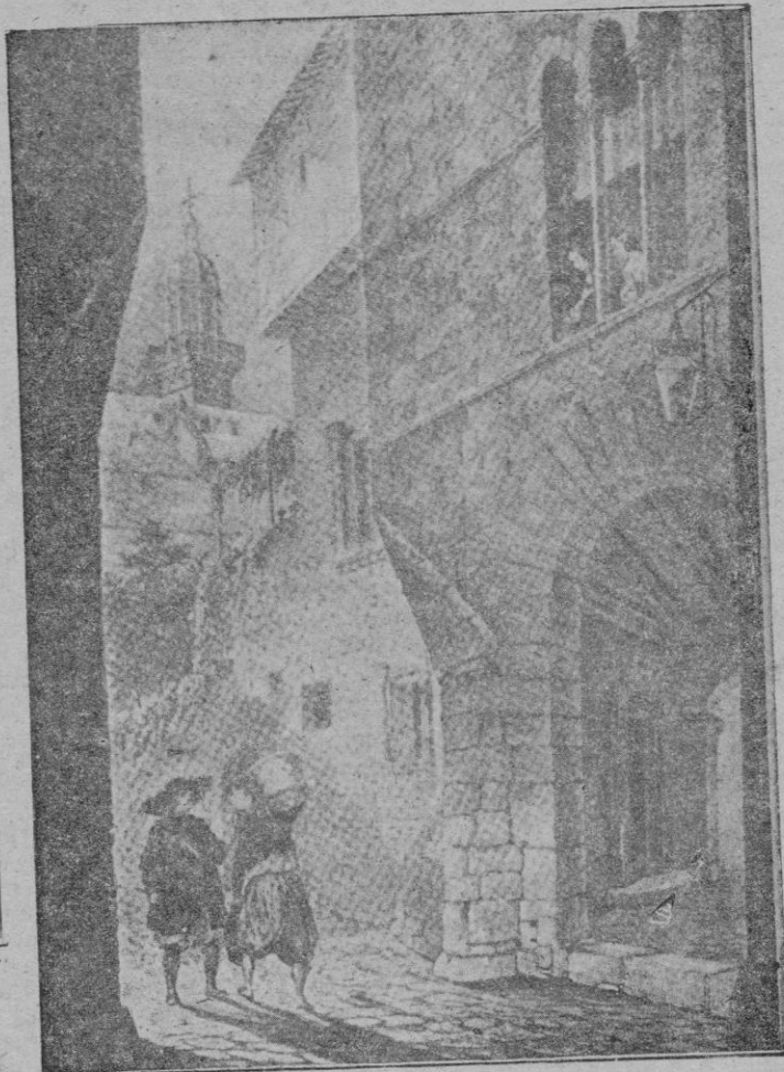
La desaparecida casa llamada de "Doña Ana" de fino estilo ojival y con ventanas ajimezadas, que, junto a San Francisco, fué orgullo de nuestras residencias urbanas. (Dibujo de Paicrisa)

nas callejeras, exponente de la devoción de nuestro pueblo y origen de las fiestas del barrio etc; etc; y como colofón el