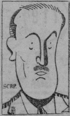
El Ministro de Obras Públicas