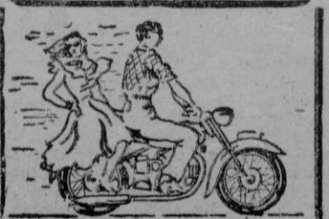
Alquile su moto en "CANELLAS PUIG" Font y Monteros 3. Tel. 2187