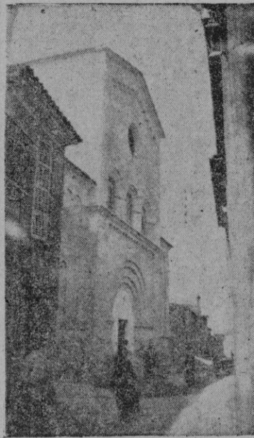
La fachada de la parroquia de Cristo Rey

Comprenderán pues nuestros lectores que la magna fecha a que hemos hecho referencia en las primeras palabras de estas