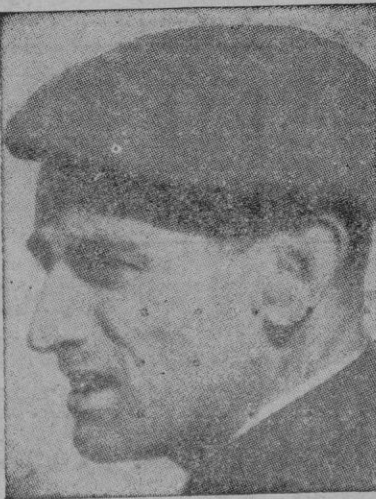
El general Muñoz Grandes, nuevo Ministro del Ejército

en la Compañía Transatlántica, e intervino como abogado del Estado en su condición de Director General, en las negociaciones para la nacionalización del capital extranjero de la Compañía Telefónica, y ha desempeñado comisiones de servicio en los Estados Unidos y en Francia.