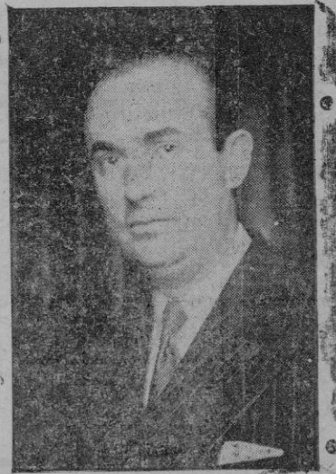
Don Manuel Arburua, nuevo Ministro de Comercio

En 1942 le fué confiada la dirección general del Banco Exterior de España y en ella a lo largo de nueve años, ha puesto de manifiesto su preparación técnica, su capacidad organizadora y su ágil sentido de las funciones financieras y comerciales. Sus conocimientos técnicos, acrecentados por una dilatada convivencia con los problemas del comercio exterior, le han hecho ser requerido para formar parte de organismos tales como el Consejo de Economía Nacional, y si su paso por el Ministerio de Industria y Comercio como Subsecretario le confiere una práctica de los problemas del departamento, su actuación como Director General del Banco Exterior de España acredita su experiencia viva de la realidad