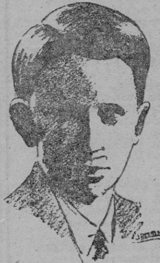
EL REY BALDUINO