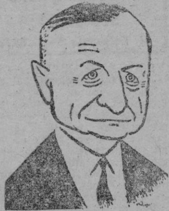
EL ALMIRANTE SHERMAN

situación con bastante seguri- dad. Por otra parte, se ha producido últimamente algu- nos conflictos laborales".