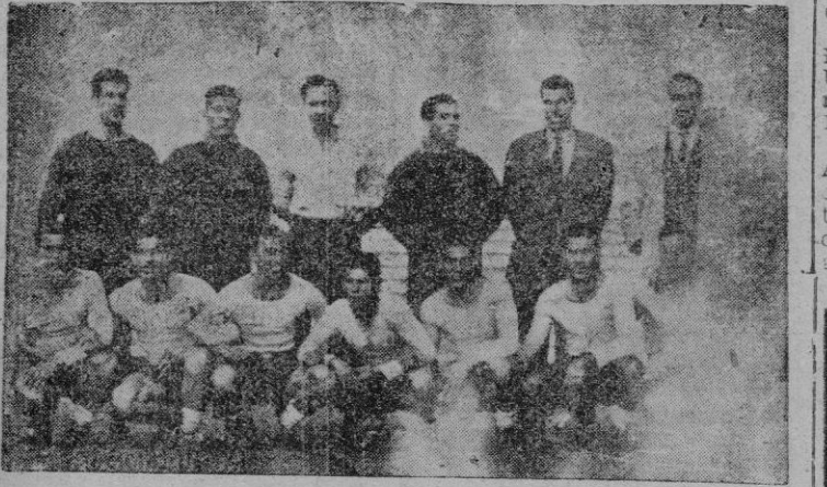
Aquí tienen Vds. a los palmenses en Es Fortí, minutos antes de comenzar su entrenamiento de ayer tarde. Las tribunas, desiertas. Tan desiertas como atestadas estarán mañana... ¿no?

La hora de la corresponder a esas bondades ha sonado. Desde ayer, los jugadores de la Unión Deportiva Las Palmas son nuestros huéspedes. Mañana, en el palenque de la lucha noble y caballerosa, van a jugar un encuentro decisivo. Cuando aparezcan sobre el rectángulo verde, debe ser unisón y clamorosa la ovación que, sin posibles dudas, diga cuáles son nuestros sentimientos no sólo a los jugadores canarios que pisen por vez primera Es Fortí si no también a toda nación deportiva palmense que, a través de la radio —Dios mediante, radiaremos el encuentro, directamente; a las tierras del archipiélago canario— estará pendiente de lo que en el estadio palmésano acontezca. Sea éste el gran saludo, la gran bienvenida del deporte mallorquín a los ejemplares deportistas de Las Palmas, que, sean vencedores o vencidos, son y serán gratisimos visitantes en esta hora como en todas.