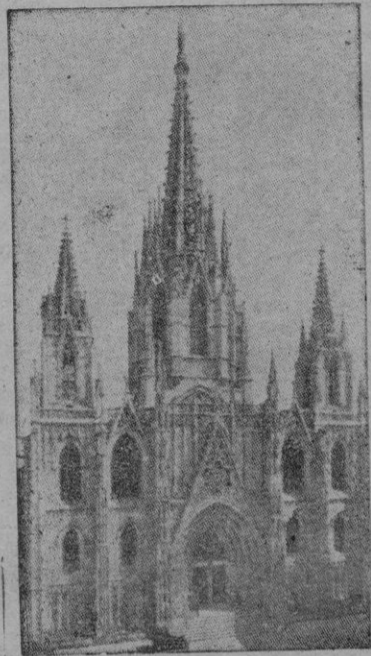
La Catedral de Barcelona

ROMA, 22 (Efe). — El Padre Sarló ha dado su aprobación para que Barcelona sea la sede del Congreso Eucarístico Internacional que se celebrará en la primavera del próximo año.