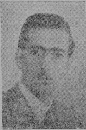
El escultor Horacio de Eguía

Horacio de Eguía, el escultor vasco que se hizo mallorquín — diez años largos de residencia entre nosotros, donde encontró esposa y hogar,