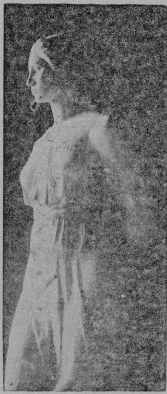
La estatua de la Esperanza, preciosa talla de Horacio de Eguía