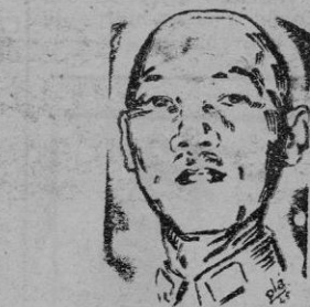
CHANG KAI SHEK

Hoy se revela que los Estados Unidos informaron "hace varios días" al Embajador británico, Sir Oliver Franks, de su propósito de continuar la lucha en Corea, estableciendo una línea de