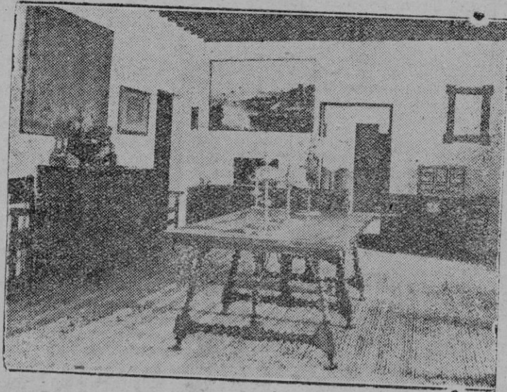
Sala de la masía de Miramar, en la costa valedmosina, uno de los sitios que más atraen la atención de los turistas