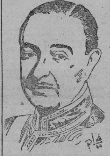
EL SR. LEQUERICA

El diario "Svenska Dagbladet" comenta la decisión, celebrándola y reconociendo que la retirada de Ministros de Madrid por instigación soviética, fué inoperante y no ha logrado más que reagrupar al pueblo español alrededor del Caudillo.