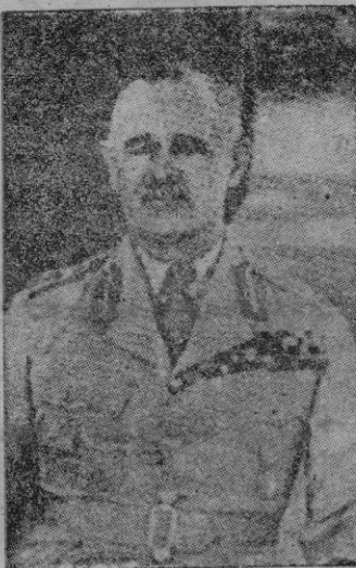
El general Wavell

Las defensas fronterizas de Halfaya, Sollum y Capuzzo estaban en manos de algunos batallones de infantería alemana. Sidi y Libyan Omar se hallaban defendidos por la división Savona con cañones alemanes y Bardia contaba con una guarnición mixta de alemanes e italianos.