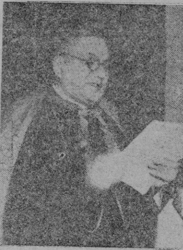
EL NUNCIO DE S. S. MONS. CICOGNANI

los participantes en estos trabajos el discutir este peoso y difícil problema.