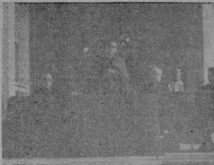
La presidencia del acto inaugural celebrado ayer en el Salón de actos del Instituto Ramón Llull. El Excmo. Sr. Obispo dirigiendo la palabra a los asistentes. (Véase información en página 4)