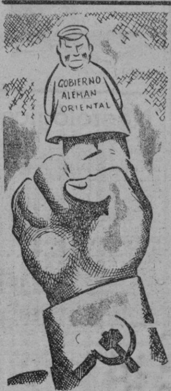
EL NUEVO ESTADO ALEMAN Teatro soviético de marionetas

Seguidamente el Jefe del Estado español expuso que en el caso de España no hubo más que parcialidad y pasión "movida por una nación y secundada por otras". Después de agradecer su actitud a las naciones que intentaron corregir la postura de la ONU frente a España, el Caudillo manifestó (Continúa en la pág. 6)