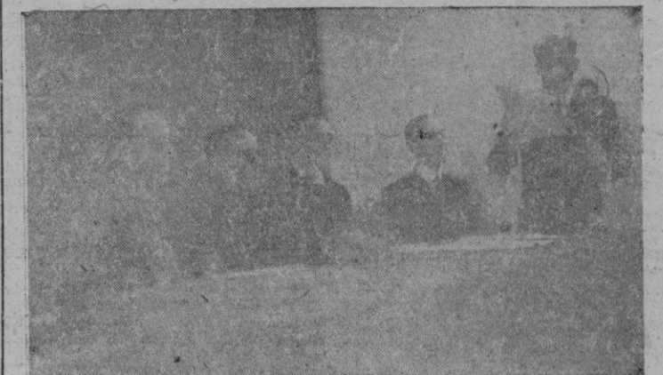
La presidencia del acto celebrada la tarde del domingo en el local de Acción Católica. El Presidente del Consejo Diocesano de los Jóvenes lee su discurso.

do Bonnin fueron sentidas y largamente aplaudidas. Por último levantóse a hablar el Excmo. y Rdm. Sr. Obispo en medio de una gran ovación. Empezó agradeciendo a Dios las grandes bendiciones derramadas sobre los Jóvenes de Acción Católica, y a éstos por los trabajos apostólicos. Refiriéndose y contestando a una pregunta del Presidente Diocesano sobre si el Sr. Obispo bendecía la obra de los Cursillos y de los "Grupos", dijo: "Los bendigo y los