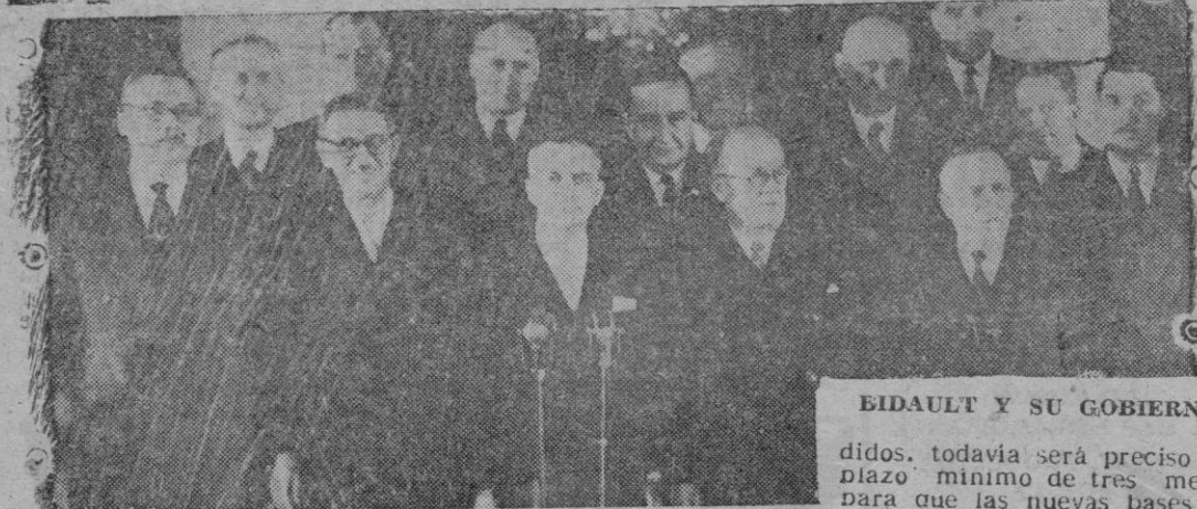
BIDAULT Y SU GOBIERNO

Pero incluso si los proyectos de ley salen rápidamente del ambiente gubernamental, son depositados inmediatamente en la Asamblea, discutidos por ella a correo seguido, y adoptados con la celeridad del caso, según calculan los enten-