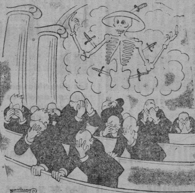
EL ESPECTRO DE CHINA EN LA U. N. O.

Un editorial del "Tribune" norteamericano de esta variación de las reacciones inglesas y francesas que no era cosa buena política de los desmantelamientos. Lo que ocurre es que ni unos ni otros cargan con las culpas errores. "No es un error dice el aludido periódico los franceses son los responsables de la situación de la política desmantelamientos de la Alemania occidental. El programa que ha durado más de lo previsto" suficientemente significativo párrafo precedente? El reconocimiento mala táctica es contra por el propio periódico norteamericano victorioso presión, desde luego, para que se cambie política, en tanto que ceses, apoyados por los nicos, propugnan lo. Esta actitud — "comunistas" — le ha valido a Britania simpatías en y, en cambio, le ha efectos desastrosos en Rusia; de manera que la parte Inglaterra ha un mal negocio ayudado franceses en su perspectiva de que se mantenga la ca de los desmantelamientos. Como es natural, los franceses acusan a los ingleses patente el testimonio de los cimos ayer, extractado "Le Monde", según el "Tribune" los ingleses previenen terminación energética de los desmantelamientos dieron a precipitación acciones de desmontaje el último ejemplar de "de" llegado a nosotros leemos confesiones de las y acaso más nobles del laborista "Tribune" desmantelamientos efectos psicológicos