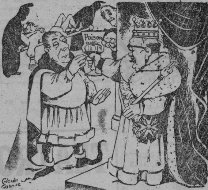
LA COPA ENVENENADA

Los belgas están dispuestos, por otra parte, a llegar hasta la libre conversión o cambio de la moneda, aprovechando el fondo de 150 millones de dólares que ha sido atribuido a la E.C.A. para facilitar esta operación. Y corre el rumor de que Van Zeeland quiere que para tal fin se atribuyera al citado fondo la totalidad de las sumas destinadas a este objeto a cada uno de los 19 pa-