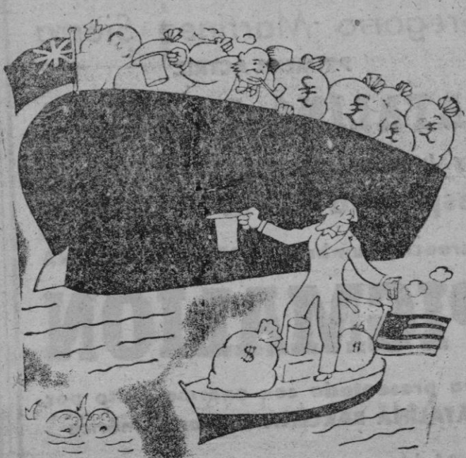
—Ya ves si es sencillo aumentar el volumen de exportación... y disminuir el de importación...