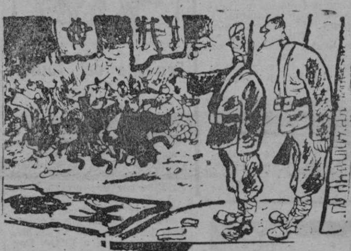
EN LA CHINA COMUNISTA