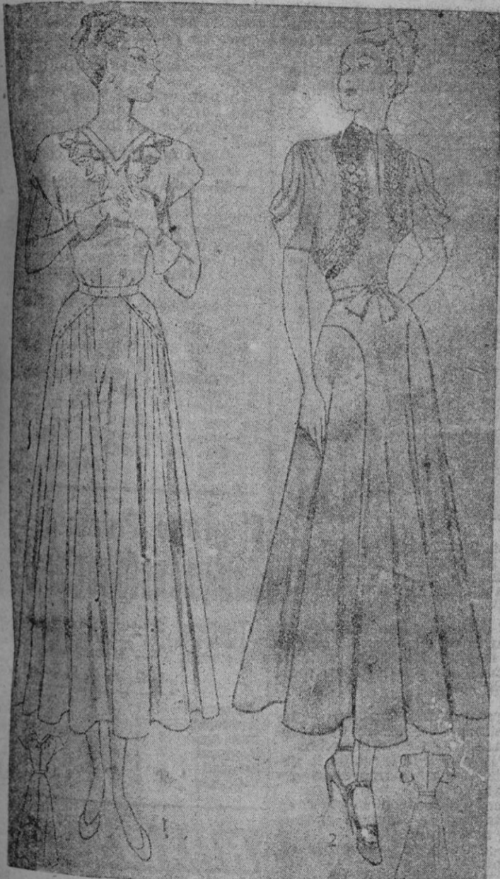
1. El escote de este vestido de crepé está bordeado por aplicaciones en tonos contrastantes; la falda es muy amplia en la delantera. — 2. Este vestido color fútsia está bordado en el tono; mangas drapadas.

La casa, pobre o rico, donde hoy una mujer hacendosa se distingue en seguida